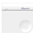
CO 2 -sensor

via de CO 2 -sensor (optioneel) (standaard instelling; 1.000 ppm)