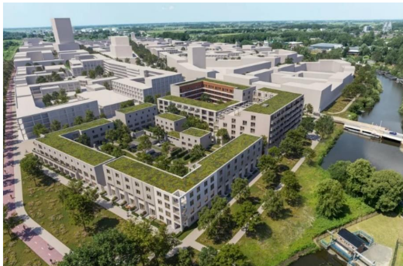
Impressie van de Suikerzijde

Voor het behalen van de geplande aantallen, zijn de corporaties mede afhankelijk van de inzet van de gemeente m.b.t. de levering van voldoende bouwgrond en het versnellen van de procedures.