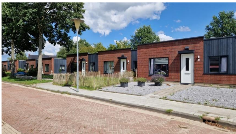
Nieuwbouw in het aardbevingsgebied

In Ten Boer West is dit al uitgewerkt in een gebiedsaanpak en wordt de komende jaren uitgevoerd. We zoeken hierbij samen zoveel mogelijk aansluiting bij bestaande initiatieven.