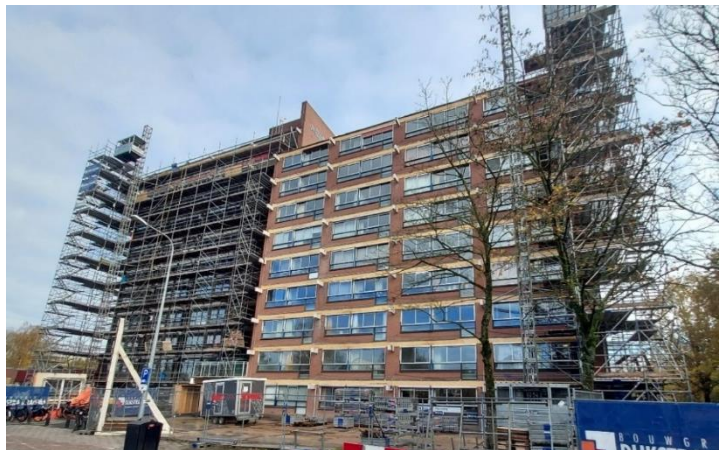
Renovatie Zuiderflat, Meer dan wonen